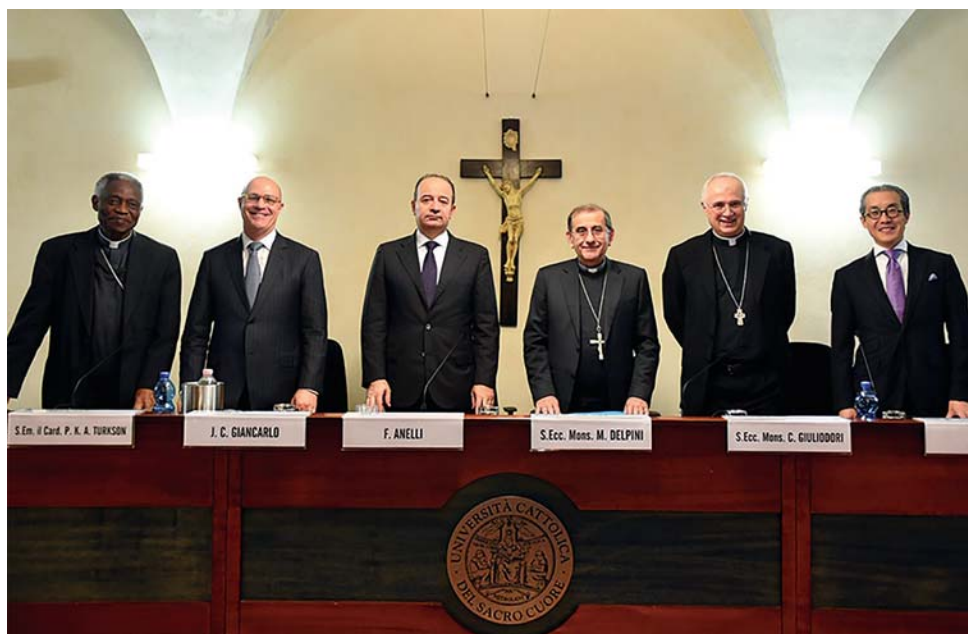
Etica e finanza, il dialogo possibile , Convegno internazionale, 23 ottobre 2019, Università Cattolica del Sacro Cuore - Milano

L'economia sarà diversa perché diversa dovrà essere la società. Delpini illustra questo osservando come il tema dell'accoglienza sia oggi silenziato. Fino ad oggi - osserva - l'accoglienza era simile all'accondiscendenza, “siamo ricchi e ti accogliamo”. Questo è paternalistico, è l'idea di chi, ricco, dice ‘vieni’, ma poi non si cura dell'altro. L'accoglienza deve essere, invece, “riconoscere il contributo che l'altro ci offre” per costruire una nuova realtà. Dobbiamo fare come le squadre di calcio che “assumono ragazzi extracomunitari non per accoglienza ma perché ne riconoscono il valore”.