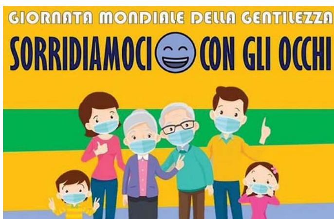
Giornata mondiale della Gentilezza, 13 novembre 2020